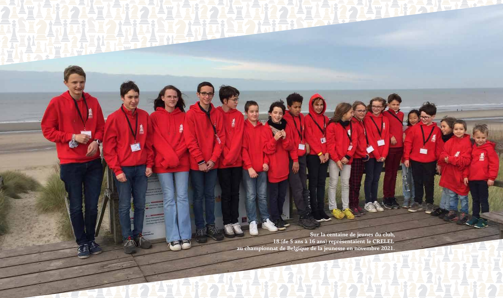
Sur la centaine de jeunes du club, 18 (de 5 ans à 16 ans) représentaient le CRELEL au championnat de Belgique de la jeunesse en novembre 2021.

pour l'organisation du championnat francophone de la jeunesse en mars 2022.